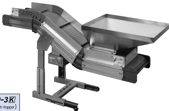
UC 1200-3K (ホッパー付 With Hopper)